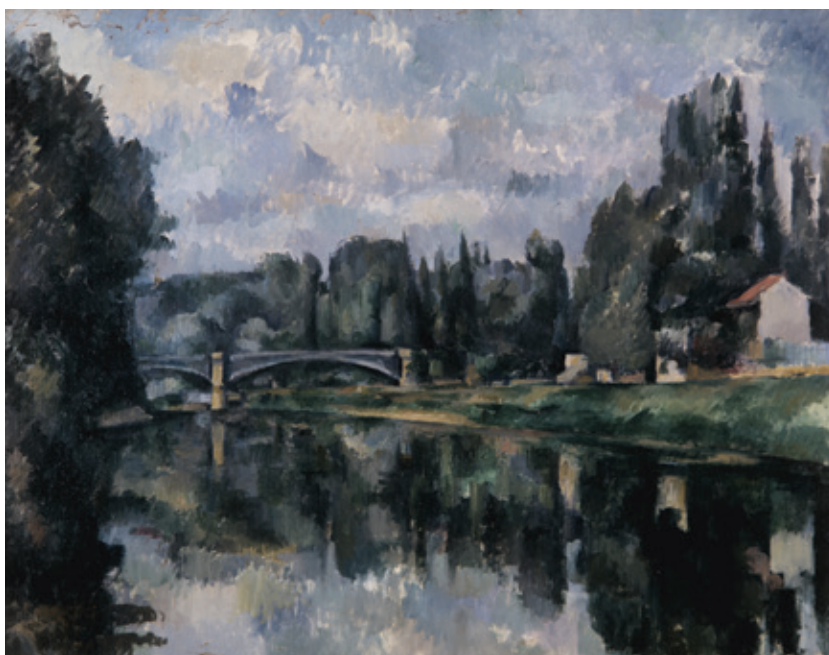
Сл. 2. Пол Сезан, Мост на Марни код Крејџеја , око 1894. (Пушкинов музеј, Москва)