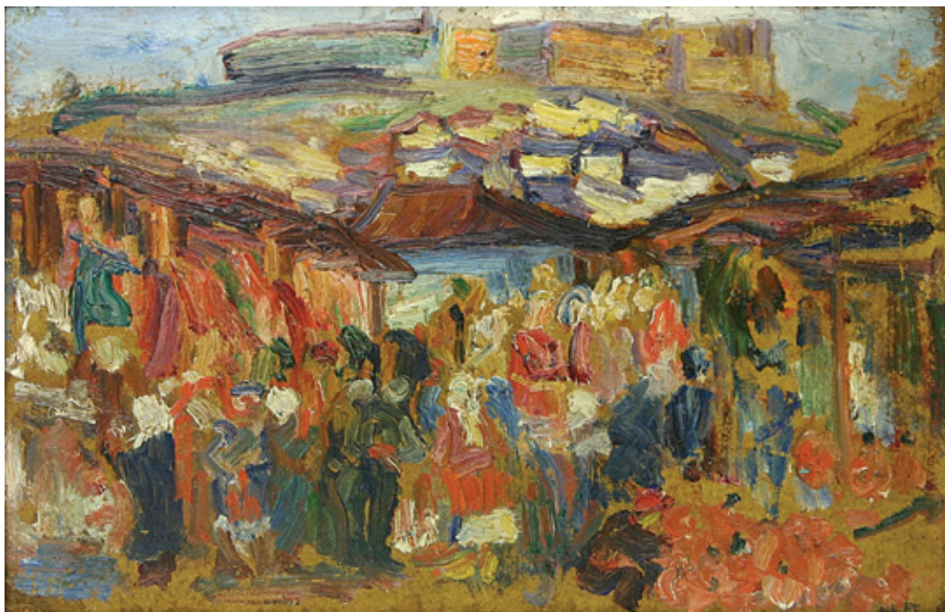
Сл. 6. Надежда Петровић, Чаршија , 1912. (Народни музеј Србије, Београд)