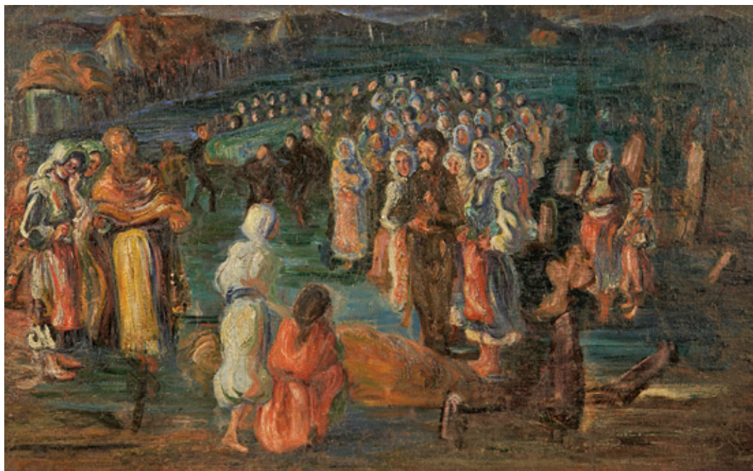
Сл. 8. Надежда Петровић, Поїреб у Сићеву , 1905. (Музеј савремене уметности, Београд)

Однос црног и белог на слици као да нам открива мисао похрањену у народном обичају. Црно, знак мушке, и бело, знак женске жалости, остају супротни у опажању а ипак једнаки по основном значењу: жена и мушкарац осећају исто, али почевши од одеће за сахрану ту жалост исказују на готово опречне начине, симболизоване супротношћу између белог и црног.