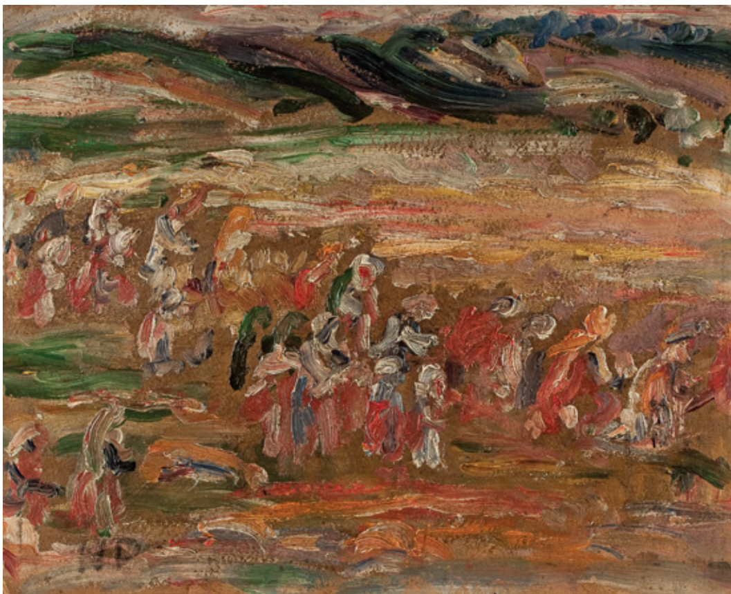
Сл. 4. Надежда Петровић, Косидба , 1912. (Народни музеј Србије, Београд)

Како показују њихови називи у каталогу изложбе (сл. 7), 12 шест од укупно девет слика урађено је у Паризу и његовој околини. Међу тим сликама, четири су класични пејзажи, а и два Ноштрдама по свему би се могла схватити као нека врста урбаних предела. Захваљујући Моши Пијаде, који је приказујући изложбу једини озбиљно и похвално писао о Надежди, знамо да су пејзажи биле и три преостале слике. „Српски предели 'Сићево', 'После вршаја' и 'На Сави'”, каже он, „схваћени су и рађени другачије од напред поменутих [париских] слика. Они се истичу лепим штимунгом” (ПИЈАДЕ 1912: 1). Ниједна од тих девет слика није, дакле, била фигуративна композиција на отвореном, као Косидба , Коло и Чаршија .