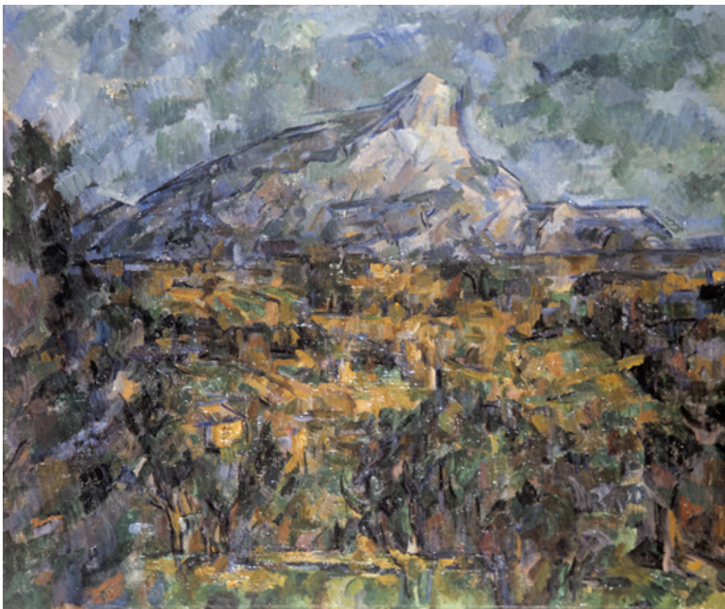
Сл. 3. Пол Сезан, Брдо Сен Виктоар , 1906. (Пушкинов музеј, Москва)