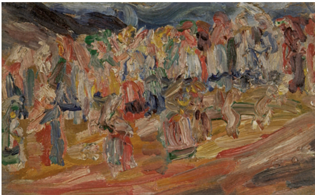
Сл. 5. Надежда Петровић, Коло , 1912. (Музеј савремене уметности, Београд)