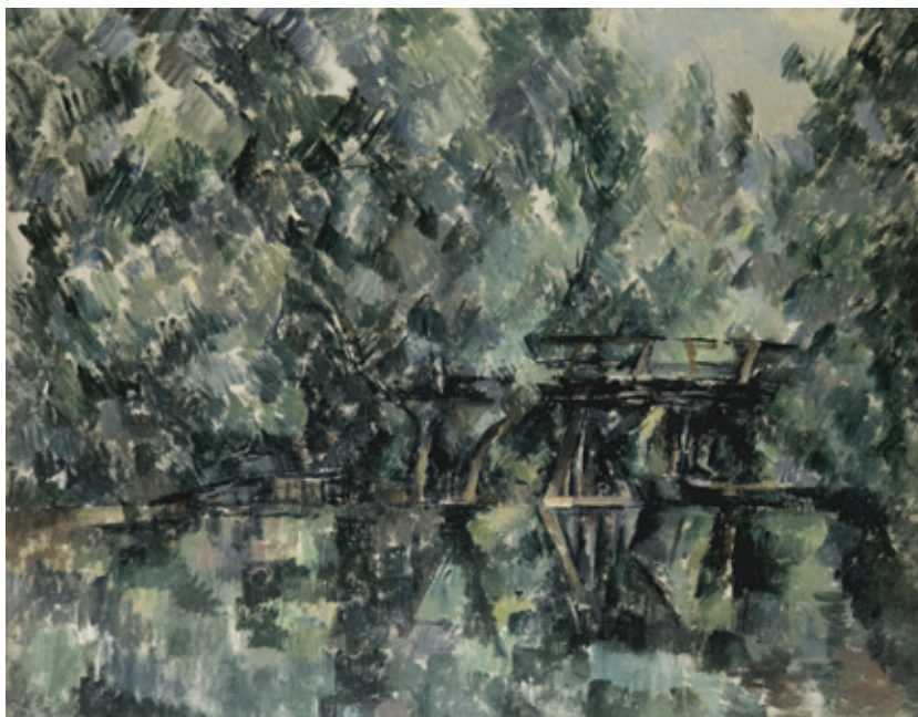
Сл. 1. Пол Сезан, Мост њреко рибњака , 1895–1898. (Пушкинов музеј, Москва)